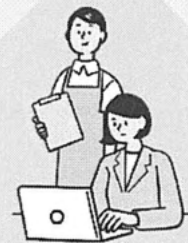
居宅サービス 事業所

国民健康保険中央会の職員による、ケアプランデータ連携システム（以下「本システム」という。）の概要の紹介、 デモ操作や疑似体験等、実践型の説明会 です。