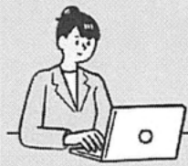
居宅介護 支援事業所